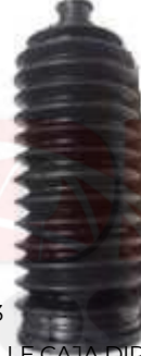
NI-5353 FUELLE CAJA DIRECCÓN TIIDA