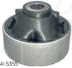
NI-5355 BUJE TIJERA TRASERO TIIDA