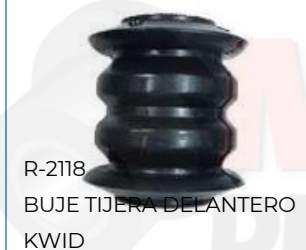
R-2118 BUJE TIJERA DELANTERO KWID