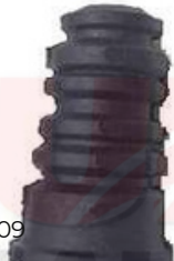
KI-5109 TOPE AMORTIGUADOR SPORTAGE