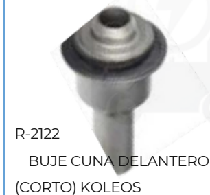
R-2122 BUJE CUNA DELANTERO (CORTO) KOLEOS