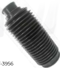
T-3956 FUELLE CAJA DIRECCIÓN PRADO - RUNNER