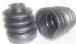
CH-2605 CH-2606 GUARDA POLVO LADO CAJA TRICETA SWIFT