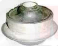
KI-5105 KI-5106 BUJE TEMPLETE DELANTEROBUJE TROQUE TRASERO STYLUS RIO XCITE