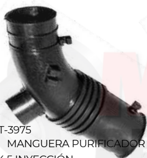
T-3975 MANGUERA PURIFICADOR 4,5 INYECCIÓN