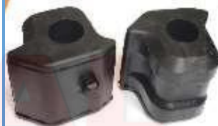
T-3978 JUEGO ESTABILIZADORAS IZQUIERDA-DERECHA RAV 4