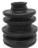
GUARDA POLVO LADO CAJA LISO SWIFT