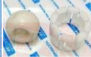
H-4435 KIT REPARACION PALANCA CAMBIOS ATOS