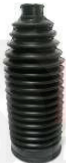
T-3959 FUELLE CAJA DIRECCIÓN VIGO