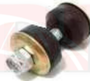
CH-3453 MUÑECO ESTABILIZADOR TROOPER