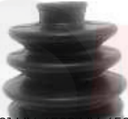
HY-4501 HY-4502 HY-4503 GUARDAPOLVO L/ RUEDA GUARDA POLVO LADO CAJA GUARDA POLVO LADO ACCENT - GIRO - VERNAL TRICETA ACCENT - GIRO CAJA EXCEL