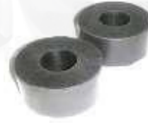
CH-3307 CH-3308 CAUCHO VARILLA TENSORA LUV 1600 LUV 1600 4 X 4