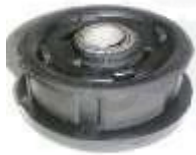
SP-3505 BUJE GUAYA GRANDE CONTROL CAMBIOS SPARK