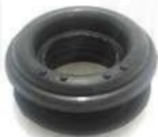
T-3914 CAUCHO CARDAN HILUX