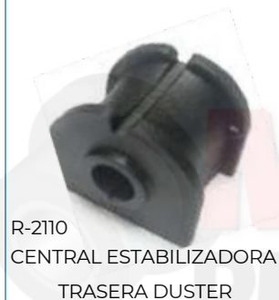
R-2110 CENTRAL ESTABILIZADORA TRASERA DUSTER