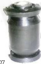
D-4307 BUJE TIJERA TICO - MATIZ