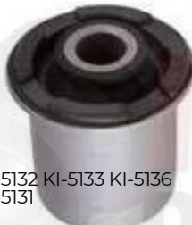
KI-5132 KI-5133 KI-5136 KI-5131