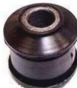
MS-4902 BUJE ESTABILIZADOR SPRINTER 515