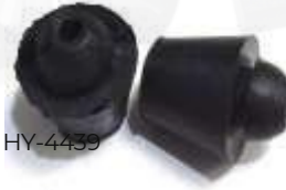
HY-4439 TOPE PUERTA ATOS