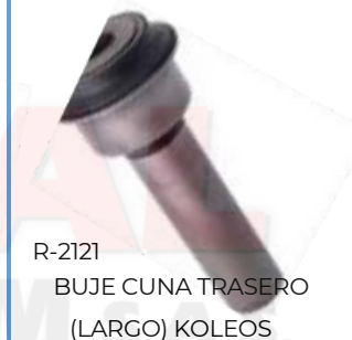
R-2121 BUJE CUNA TRASERO (LARGO) KOLEOS