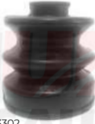
CH-3302 GUARDA POLVO LADO CAJA LUV 1600