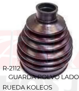
R-2112 GUARDA POLVO LADO RUEDA KOLEOS