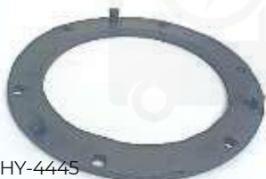
HY-4445 CAUCHO EMPAQUE TAPA TANQUE GASOLINA ATOS