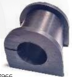
T-3966 ESTABILIZADORA DELANTERA HILUX REVO