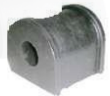
HY-4508 ESTABILIZADORA TRASERA ACCENT - GIRO - VERNAL