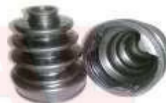
T-3912 GUARDA POLVO LADO CAJA COROLLA