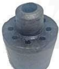
R-2046 CAUCHO SOPORTE RADIADOR