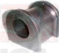
CH-3203 ESTABILIZADORA GRAN VITARA SUZUKI