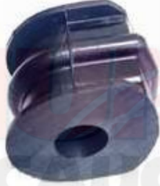
NI-5360 CENTRAL ESTABILIZADORA DELANTERA MARCH