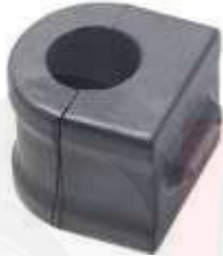
CH-2751 CH-2752 ESTABILIZADORA CENTRAL BUJE TIJERA PUÑO DELANTERA CAPTIVA CAPTIVA