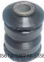
NI-5356 NI-5357 NI-5358 BUJE TIJERA DELANTERO