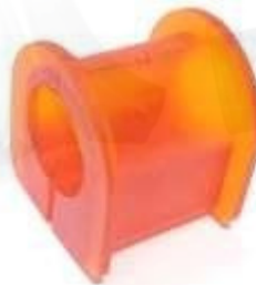
ESTABILIZADORA DELANTERA VIGO