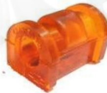
ESTABILIZADORA CENTRAL SPARK INYECTADA