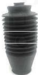
T-3913 FUELLE CAJA DIRECCIÓN COROLLA