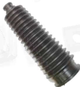
FUELLE CAJA DIRECCIÓN