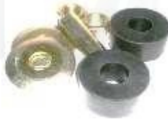
CH-3306 KIT VARILLA TENSORA LUV 1600