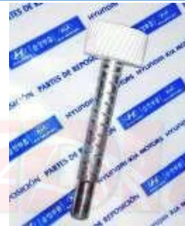
HY-4443 PIÑON VELOCIMETRO ATOS