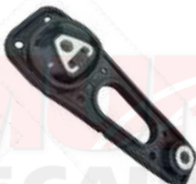
SOPORTE CAJA DUSTER