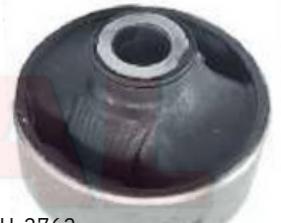
CH-2762 BUJE TIJERA TRASERO SONIC COBALT