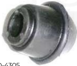
D-4305 ESTABILIZADORA PUNTA TICO - MATIZ