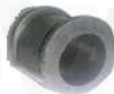
CH2607 ESTABILIZADORA DELANTERA SWIFT