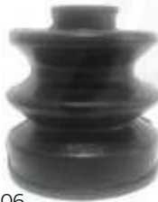
CH-3206 GUARDAPOLVO LADO CAJA VITARA