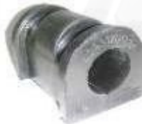
SP-3506 ESTABILIZADORA CENTRAL SPARK VULCANIZADA