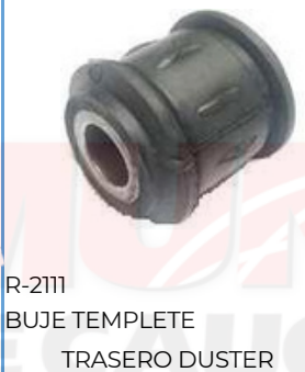
R-2111 BUJE TEMPLETE TRASERO DUSTER