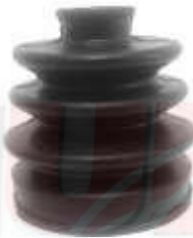
GUARDAPOLVO LADO RUEDA