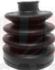
CH-3452 GUARDA POLVO LADO CAJA TROOPER