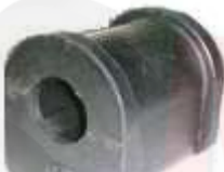
HY-4509 HY-4510 HY-4511 HY-4512