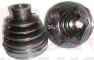
T-3952 GUARDAPOLVO LADO CAJA VIGO