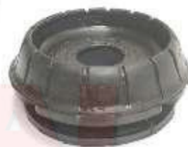
R-2044 SOPORTE AMORTIGUADOR DELANTERO TWINGO M/N (ALTA)