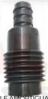
NI-5354 FUELLE AMORTIGUADOR DELANTERO TIIDA