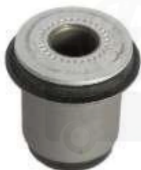
T-3971 BUJE TIJERA INFERIOR MEDIANO PRADO TXL