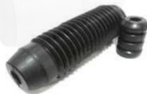
T-3916 FUELLE AMORTIGUADOR TRASERO COROLLA