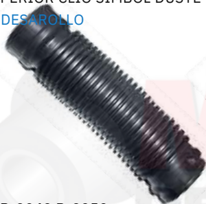
R-2049 R-2050 MANGUERA PURIFICADOR LOGAN - SANDERO