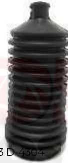
D-4303 D-4304 FUELLE CAJA DIRECCIÓN ESTABILIZADORA TICO - MATIZ CENTRAL TICO - MATIZ