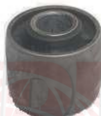
T-3969 BUJE AMORTIGUADOR HILUX VIGO