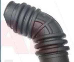
MANGUERA PURIFICADOR SPORTAGE