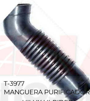
T-3977 MANGUERA PURIFICADOR HILUX HI-RIDER