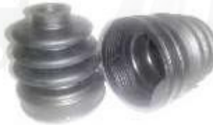
KI-5102 GUARDA POLVO LADO CAJA RIO