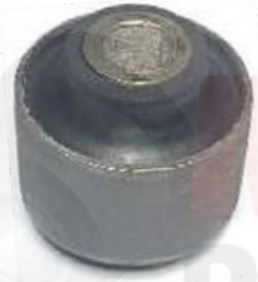
NI-5359 BUJE TIJERA DELANTERO MARCH - VERSA - NOTE