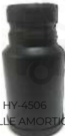
HY-4505 HY-4506 FUELLE AMORTIGUADOR FUELLE AMORTIGUADOR DELANTERO ACCENT - GIRO TRASERO ACCENT - GIRO -