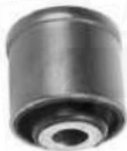
R-2053 R-2054 BUJE TIJERA DELANTERO BUJE TIJERA TRASERO (PESTAÑA) CLIO I (LISO) CLIO I