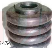
H-4434 FUELLE CONTROL VELOCIDADES ATOS