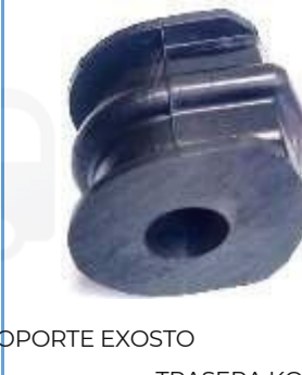
SOPORTE EXOSTO TRASERA KOLEOS