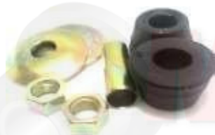
T-3909 KIT VARILLA TENSORA HILUX