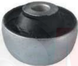
V-4806 BUJE TIJERA TRASERO JETTA FOX GOL GOLF VOYAGE