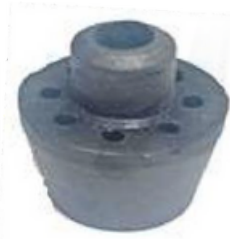
R-2047 BUJE PUENTE TRASERO R-2048