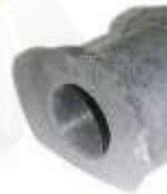
HY-4507 ESTABILIZADORA DELANTERA ACCENT