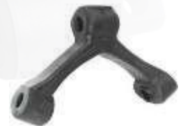
V-4808 SOPORTE EXOSTO GOL BORA AUDI A 3