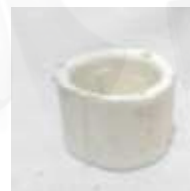
SP-3515 BUJE CAJA DIRECCIÓN SPARK