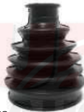
SP-3502 GUARDAPOLVO LADO RUEDA SPARK