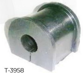
T-3958 ESTABILIZADORA TRASERA PRADO