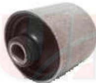
SP-3510 BUJE TEMPLATE TRASERO GRUESO SPARK 724