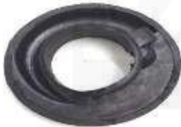
V-4805 SUPLEMENTO ESPIRAL TRASERO TRANSPORTER