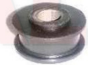
SP-3504 BUJE GUAYA PEQUEÑO CONTROL CAMBIOS SPARK