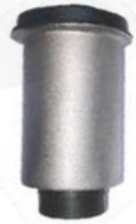
CH-3208 BUJE TIJERA DELANTERO GRAND VITARA SZ