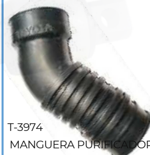
T-3974 MANGUERA PURIFICADOR PRADO/ 4 RUNNER