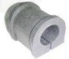
DELANTERA RIO STYLUS