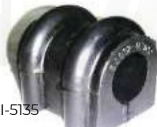
KI-5135 CAUCHO ESTABILIZADORA CENTRAL GRAND SEPHIA