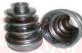
GUARDAPOLVO LADO CAJA