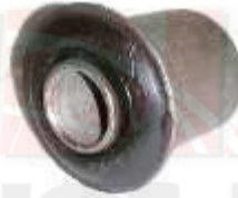
CH-3303 BUJE TIJERA SUPERIOR LUV 1600