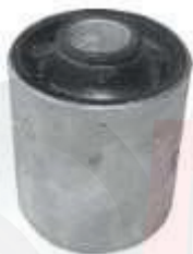
M-2551 BUJE TIJERA METÁLICO MATSURI