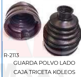
R-2113 GUARDA POLVO LADO CAJA TRICETA KOLEOS