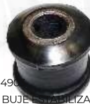
MS-4902 BUJE ESTABILIZADOR SPRINTER 323-413