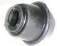
SP-3508 ESTABILIZADORA PUNTA SPARK