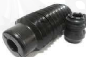
T-3915 FUELLE AMORTIGUADOR DELANTERO COROLLA