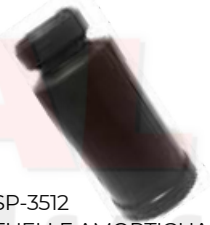
SP-3512 FUELLE AMORTIGUADOR SPARK