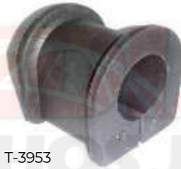
T-3953 ESTABILIZADORA CENTRAL VIGO