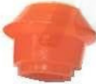
D-4306 ESTABILIZADORA PUNTA NERANJA TICO - MATIZ