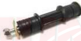
ESTABILIZADORA MUÑECO ESTABILIZADORA MUÑECO ESTABILIZADORA SOPORTE EXOSTO DELANTERA GIRO - VERNAL ACCENT EXCEL ACCENT - EXCEL - ELANTRA