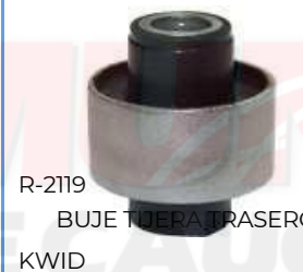
R-2119 BUJE TIJERA TRASERO KWID