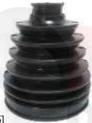
T-3951 GUARDA POLVO LADO RUEDA VIGO