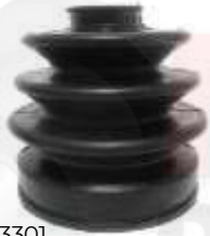
CH-3301 GUARDA POLVO LADO RUEDA LUV 1600