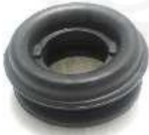
CH-3305 CAUCHO CARDAN LUV 1600