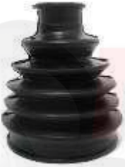
D-4301 GUARDA POLVO LADO RUEDA TICO - MATIZ