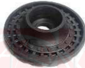
DELANTERO SPARK GT SIN BUJE TIEJRA METAL