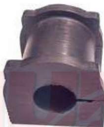
T-3968 CAUCHO ESTABILIZADORA TRASERA PRADO TXL