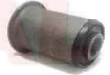
CH-3304 BUJE TIJERA INFERIOR LUV 1600 4 X 2