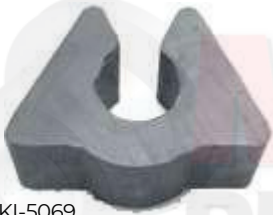
KI-5069 KI-5067 KI-5068

CAUCHO ESTABILIZADORA BUJE PUNTE TRASERO PURIFICADOR TRASERA PICANTO ION PICANTO ION -GRAND i-10 i-25 PICANTO ION