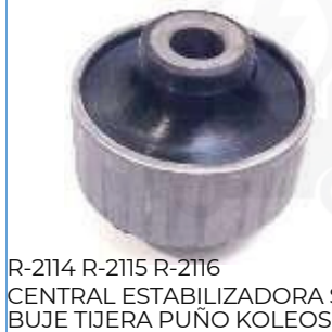
R-2114 R-2115 R-2116 CENTRAL ESTABILIZADORA BUJE TIJERA PUÑO KOLEOS