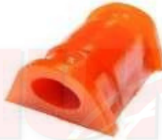
HY-4442 CENTRAL ESTABILIZADORA ATOS H. GRANDE INYECTADA