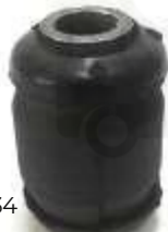
KI-5134 BUJE TIJERA CAUCHO GRAND SEPHIA