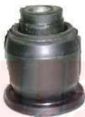
M-2552 BUJE TIJERA CAUCHO MATSURI