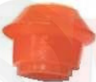
SP-3509 ESTABILIZADORA PUNTA SPARK INYECTADA