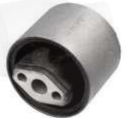
CH-2758 BUJE TIJERA PUÑO TRACKER