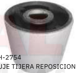
CH-2754 BUJE TIJERA REPOSICION CAPTIVA