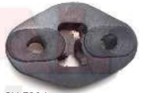
CH-3204 SOPORTE EXOSTO GRAND VITARA