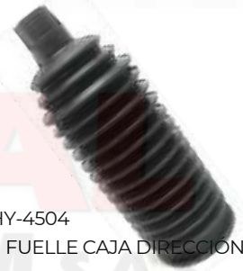
HY-4504 FUELLE CAJA DIRECCION ACCENT - EXCEL