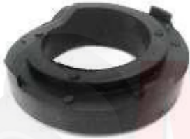
H-4433 SUPLEMENTO ESPIRAL TRASERO ATOS