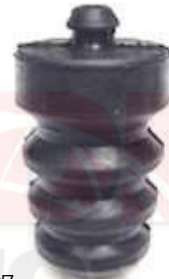
KI-5107 TOPE AMORTIGUADOR TRASERO RIO