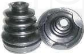
T-3955 GUARDA POLVO LADO CAJA PRADO