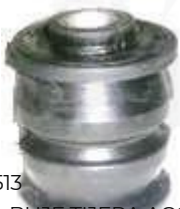
HY-4513 BUJE TIJERA ACCENT ABRAZADERA ESTABILIZADORA DELANTERA GIRO VERNAL