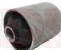
SP-3511 BUJE TEMPLATE TRASERO DELGADO SPARK 724