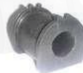
CH-2608 ESTABILIZADORA TRASERA SWIFT