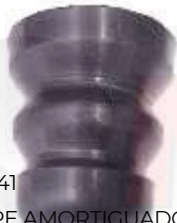
SP-3541 TOPE AMORTIGUADOR DELANTERO SPARK GT