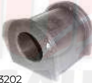
CH-3202 ESTABILIZADORA GRAN VITARA CHEVROLET