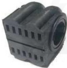
CH-2755 CH-2756 CENTRAL ESTABILIZADORA GUARDAPOLVO LADO DELANTERA TRACKER RUEDA TRACKER