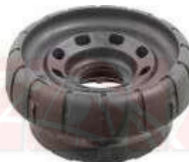
R-2051 R-2052 SOPORTE AMORTIGUADOR SOPORTE AMORTIGUADOR RODAMIENTO DELANTERO TRAFIC DELANTERO TRAFIC CON