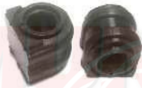
SP-3534 SP-3535 SP-3536 SOPORTE AMORTIGUADOR CENTRAL ESTABILIZADORA SPARK GT RODAMIENTO SAPRK GT