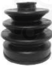
CH-3205 GUARDA POLVO LADO RUEDA VITARA