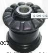
V-4807 BUJE TIJERA GOL