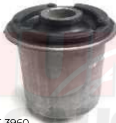
T-3960 BUJE TIJERA SUPERIOR VIGO 4X2 - 4X4