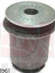
T-3961 BUJE TIJERA INFERIOR MEDIANO VIGO 4X4