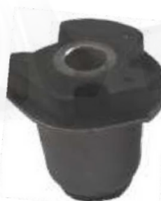
CAUCHO SOPORTE RADIADOR MANGUERA PURIFICADOR