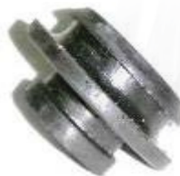
SP-3514 SOPORTE RADIADOR SPARK