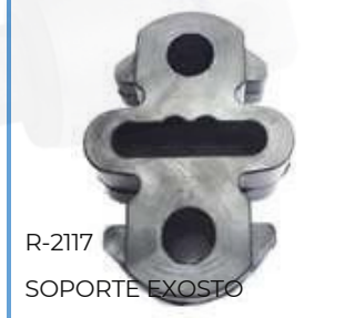
R-2117 SOPORTE EXOSTO TRASERO DUSTER 4X4