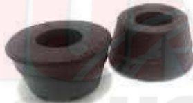
T-3910 CAUCHO VARILLA TENSORA HILUX