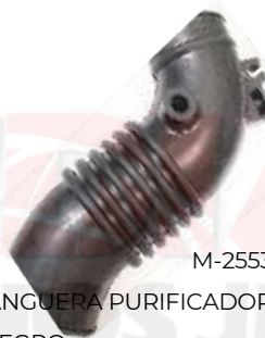
M-2553 MANGUERA PURIFICADOR ALLEGRO