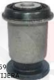
CH-2759 BUJE TIJERA MEDIANO TRACKER