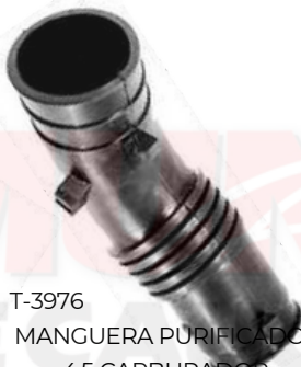
T-3976 MANGUERA PURIFICADOR 4,5 CARBURADOR