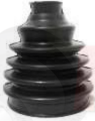
NI-5351 GUARDAPOLVO LADO RUEDA TIIDA