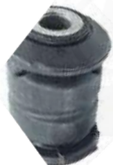
CH-2763 CH-2765 BUJE TIJERA DELANTERO SOPORTE CAJA