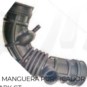
SOPORTE EXOSTO MANGUERA PURIFICADOR TRASERO SONIC SPARK GT SPARK GT