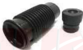
CH-2602 FUELLE AMORTIGUADOR DELANTERO SWIFT