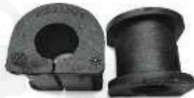
V-4806 ESTABILIZADORA DELANTERA AMAROK