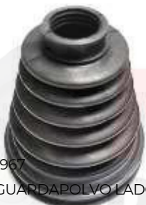
T-3967 GUARDAPOLVO LADO CAJA PRADO TXL