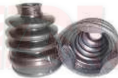
SP-3503 GUARDA POLVO LADO CAJA SPARK