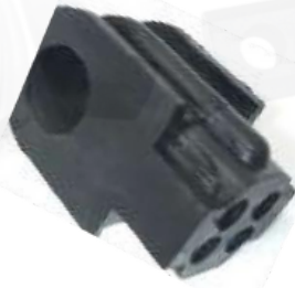
CENTRAL ESTABILIZADORA TIIDA DELANTERA