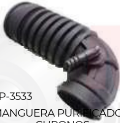
SP-3533 MANGUERA PURIFICADOR CHRONOS