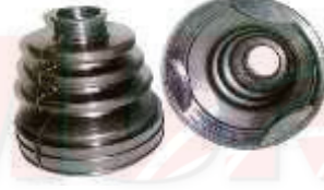
NI-5352 GUARDAPOLVO LADO CAJA TIIDA