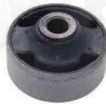
CH-3207 BUJE TIJERA TRASERO GRAND VITARA SZ