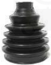
KI-5101 GUARDA POLVO LADO RUEDA RIO