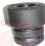
TOPE AMORTIGUADOR DELANTERO SWIFT