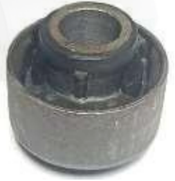
BUJE TIJERA TRASERO TIIDA MARCH - VERSA - NOTE