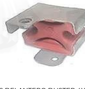
DELANTERO DUSTER 4X4