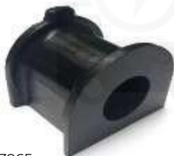
T-3963 T-3964 ESTABILIZADORA GUARDAPOLVO LADO RUEDA DELANTERA PRADO TXL PRADO TXL