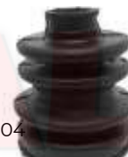
CH-2604 GUARDA POLVO LADO RUEDA SWIFT