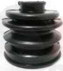
CH-3451 GUARDA POLVO LADO RUEDA TROOPER