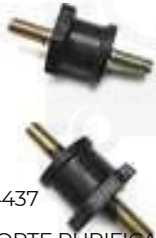
HY-4437 SOPORTE PURIFICADOR ATOS