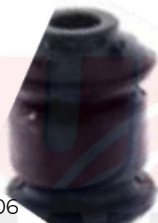
V-4806 BUJE TIJERA DELANTERO JETTA FOX GOL GOLF VOYAGE