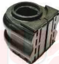
CH-2760 CH-2761 ESTABILIZADORA CENTRAL MANGUERA PURIFICADOR DELANTERA SONIC TRACKER