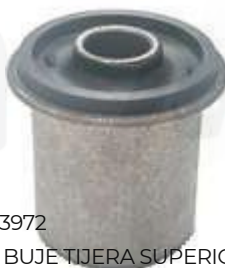
T-3972 BUJE TIJERA SUPERIOR PRADO