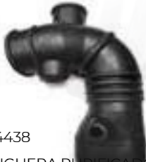
HY-4438 MANGUERA PURIFICADOR GRANDE ATOS