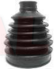
T-3954 GUARDAPOLVO LADO RUEDA PRADO