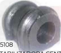
KI-5108 ESTABILIZADORA CENTRAL DELANTERA SPORTAGE