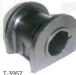
T-3957 ESTABILIZADORA DELANTERA PRADO