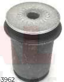
T-3962 BUJE TIJERA INFERIOR GRANDE VIGO 4X4