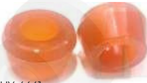
HY-4441 CAUCHO ESTABILIZADOR CONICO TRASERO ATOS