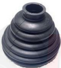
R-2041 R-2042 R-2043 GUARDAPOLVO LADO RUEDA CENTRAL ESTABILIZADORA MASTER JUMPER (COLECTIVAS) DELANTERA TRAFIC DELANTERO TRAFIC - MASTER