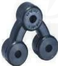
SP-3513 SOPORTE EXOSTO SPARK