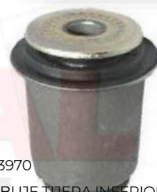
T-3970 BUJE TIJERA INFERIOR GRANDE PRADO TXL