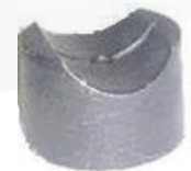
SP-3516 MUELA CAJA DIRECCIÓN SPARK