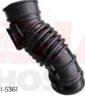
NI-5361 MANGUERA PURIFICADOR TIIDA