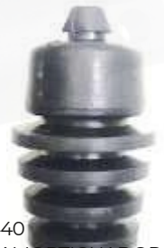
HY-4440 TOPE AMORTIGUADOR TRASERO ATOS M.NUEVO