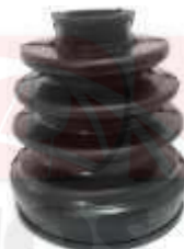
T-3911 GUARDA POLVO LADO RUEDA COROLLA