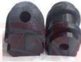
KI-5110 KI-5111 ESTABILIZADORA CENTRAL TRASERA SPORTAGE RIO STYLUS