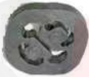
V-4801 V-4802 LIGA EXOSTO VOLKSWAGEN SOPORTE EXOSTO MODELOS NUEVOS JETTA