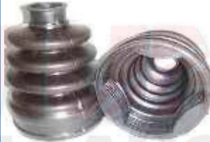
D-4302 GUARDA POLVO LADO CAJA TICO - MATIZ