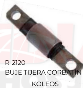
R-2120 BUJE TIJERA CORBATIN KOLEOS